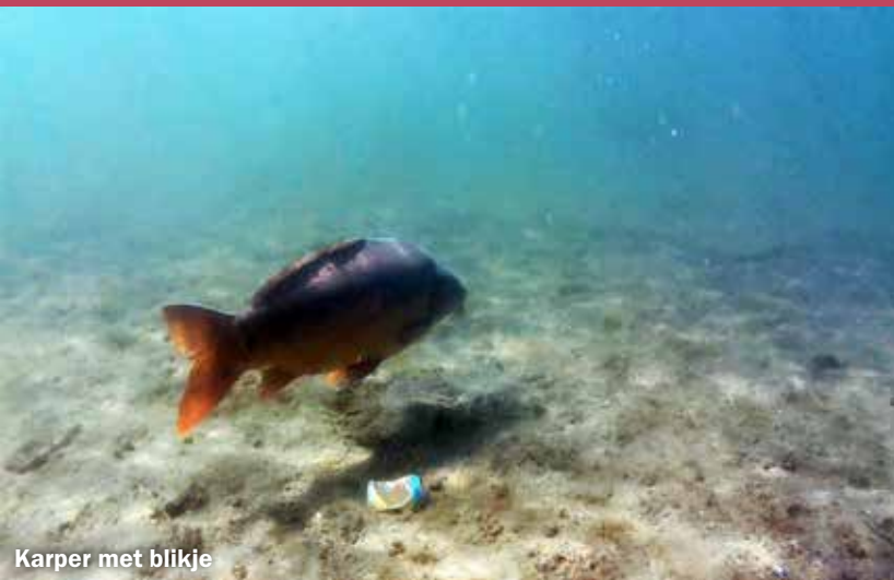
Karper met blikje

Wie bij zonnig weer vóór de drukte in de Berendonck gaat snorkelen zal merken dat er best veel te zien is. Het water is heel helder buiten de drukte om. Diverse soorten vis leven er waaronder flink grote karpers. Ook twee soorten Amerikaanse rivierkreeften komen voor. Al deze foto's zijn gemaakt tussen 1,5 en 3 meter diepte.