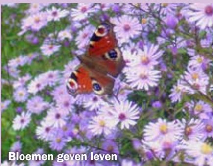
Bloemen geven leven