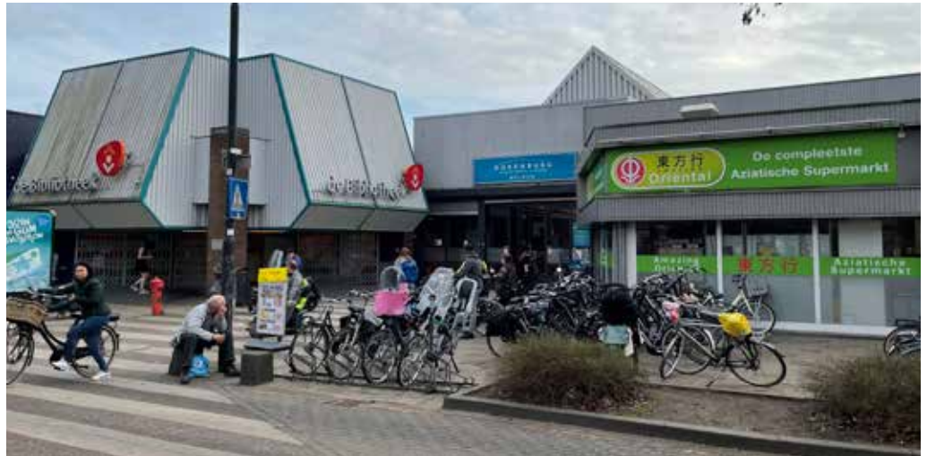
Huidige ingang van Winkelcentrum Dukenburg in Zwanenveld 80° straat. Eén van de opties is om deze straat op te heffen en te vervangen door groen

De gemeenteraad is het daar niet mee eens. Stadspartij Nijmegen, D66, GroenLinks, PvdA en CDA hebben een motie ingediend die met algemene stemmen is aangenomen. De raad