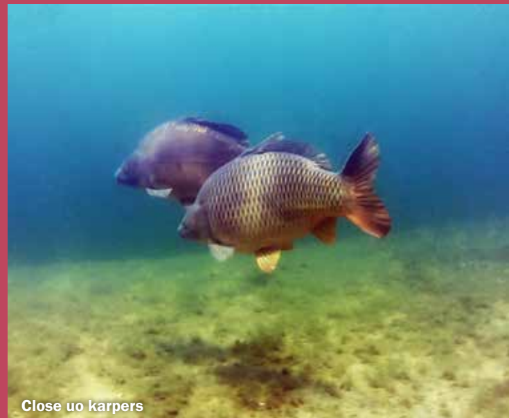
Close up karpers