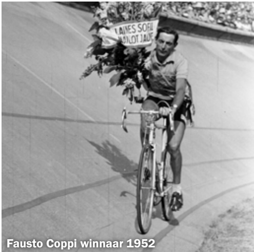
Fausto Coppi winnaar 1952

Nederland was in 1936 voor het eerst vertegenwoordigd in de Tour de France. Theo Middeldkamp schreef dat jaar als eerste Nederlandse renner een etappe op zijn naam. Daarna speelden de Nederlandse renners geen rol van betekenis meer. Zoals in 1949, toen niet één Nederlandse renner de finish in Parijs haalde.