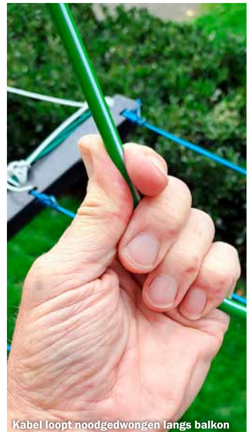
Kabel loopt noodgedwongen langs balkon