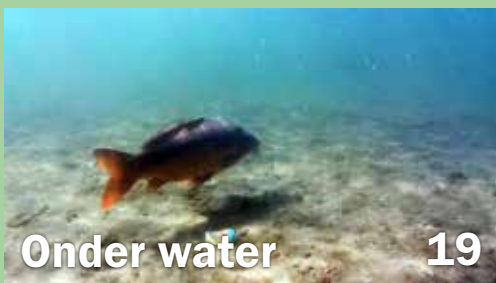
Onder water 19