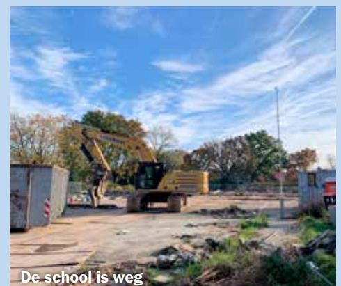
De school is weg

Tekst: Peter Saras.