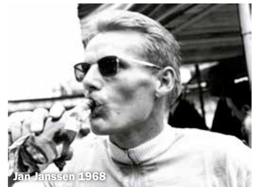
Jan Janssen 1968

Maar het grote succes was in 1968 waar Jan Janssen als eerste Nederlander de Tour de France won. Hij deed dit op de laatste dag toen de Tour afgesloten werd met een tijdrit. Hierin versloeg hij de Belg Herman van Springel.