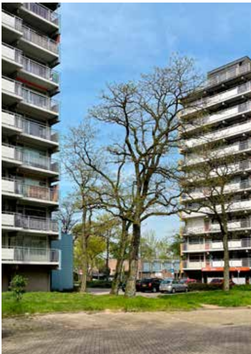
Zwanenveld 20°/21° en 22° straat, flats die een nieuwe warmtevoorziening moeten krijgen

Op 27 september 2023 hebben Provinciale Staten besloten subsidie te verlenen om een warmtenet Nijmegen-Dukenburg fase 1 te realiseren.