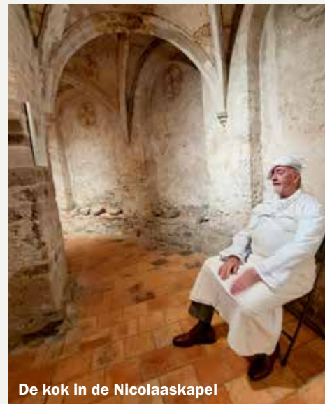
De kok in de Nicolaaskapel

De 45-jarige Valkhofvereniging is opgericht in 1978, toen de kapel in zeer slechte staat verkeerde. De gemeente gebruikte het unieke historische bouwwerk als opslag voor tuingereedschap. De vereniging nam het beheer over; vrijwilligers zorgen ervoor dat de deuren van de kapel vaak open zijn. 'Onze doelstelling is altijd geweest om de kapel zo veel mogelijk aan de mensen te la-