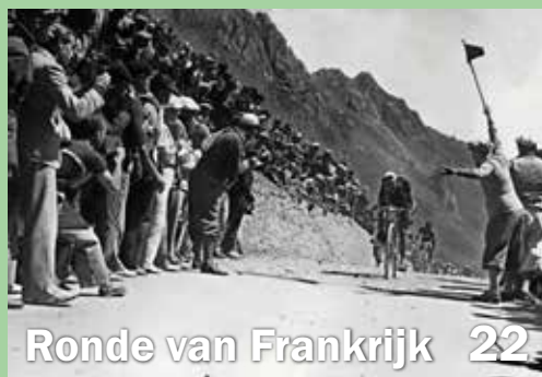
Ronde van Frankrijk 22