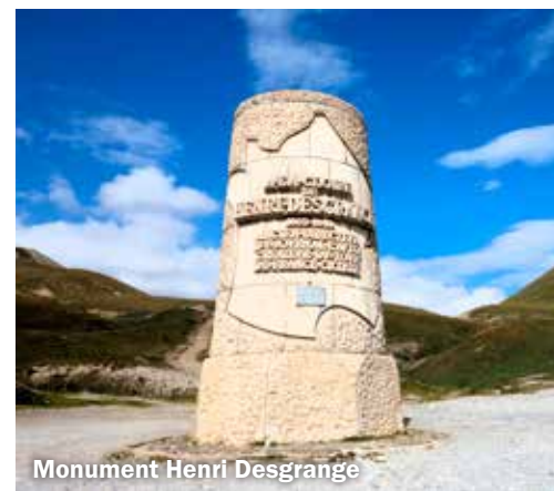
Monument Henri Desgrange

Peugeot, toen al bekend van auto's en fietsen. In 1930 veranderde dit en werden het tot 1962 landenploegen met een landenklassement en werd in dat jaar ook de eerste reclamekaravaan ingevoerd. Daarna werden het opnieuw, tot op heden, commerciële ploegen. Wil je tegenwoordig meedoen dan moet het budget miljoenen euro's bedragen, zoals bij Jumbo-Visma waar de winnaar van de laatste twee jaar onder contract staat. Deze ploeg wordt momenteel als de beste wielerploeg ter wereld gezien.