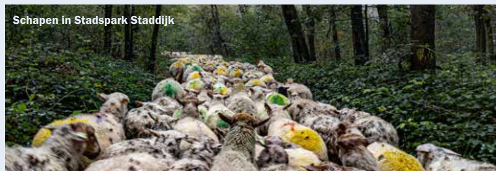
Schapen in Stadspark Staddijk

Dukenburg heeft als achtertuin de Overasseltse en Hatertse Vennen. Geloof maar dat daar duizenden voetstappen liggen van stadsdeelnemers. Die wandelen er als de heide bloeit, of als er sneeuw ligt. Helemaal aan de noordkant, waar de Hippe Kip herinnert aan de jaren 70 staan overigens ook veel bomen en struikgewas. Over de heuveltjes van het Dela-terrein lopend beleeft de wandelaar een parkgevoel. De stadsnomaden wonen de komende jaren fijn in het groen.