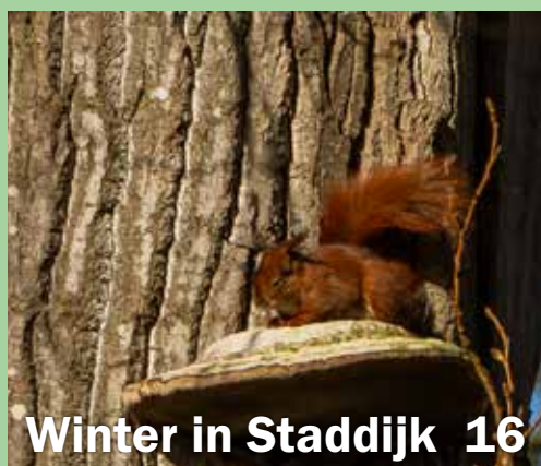
Winter in Staddijk 16