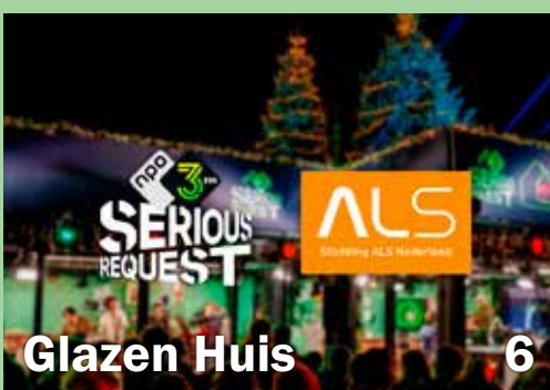
Glazen Huis 6