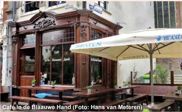
Café In de Blaauwe Hand