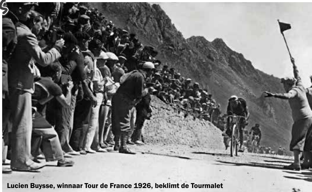
Lucien Buysse, winnaar Tour de France 1926, beklimt de Tourmalet

Tot geruststelling van Desgrange, die vreesde dat het buitenland met de ronde aan de haal