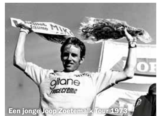
Een jonge Joop Zoetemelk Tour 1973

In 1980 was Joop Zoetemelk, tot op heden Nederlands beste wielrenner, de volgende Nederlandse winnaar nadat hij zes keer tweede geworden was. Vandaar zijn bijnaam Eeuwig tweede . Hij reed zestien maal de Tour de France, die hij allemaal uitreed, en eindigde dertien keer binnen de top tien van het klassement.