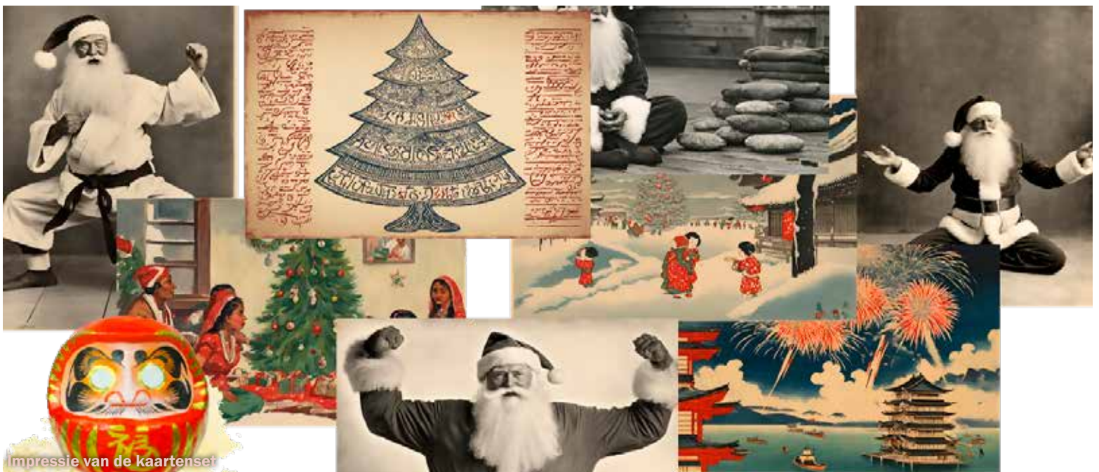
Impressie van de kaartenset