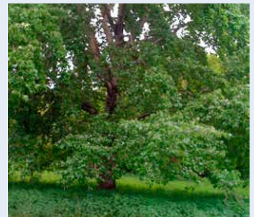
Boom in Lindenholt-Noord

Bij het tankstation schuin voor Orient Plaza kiest men het fietspad links richting A73. Via bruggetje de wijk inslaan. Door aldoor de buitenste haag rondom Lindenholt te volgen, ziet men volkstuinjes en particuliere tuinen tot in de Duitse Bocht . Daarna een laanstructuur aan de noordkant van Lindenholt. Hier plaveien paden een parkachtig groenland, dat men verschillend kan doorkruisen. Via het Fausto Coppipad de Hogelandseweg overgestoken richting het Maas-Waalkanaal groeit rondom bossig groen. Evenals langs Maas-Waalkanaal