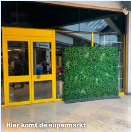
Hier komt de supermarkt

De Voedselbank Nijmegen Overbetuwe gaat een supermarkt beginnen voor haar klanten.