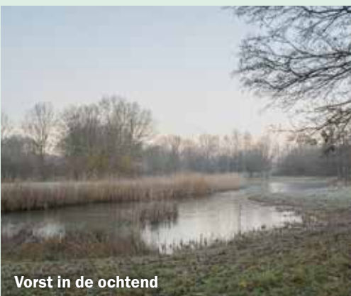
Vorst in de ochtend