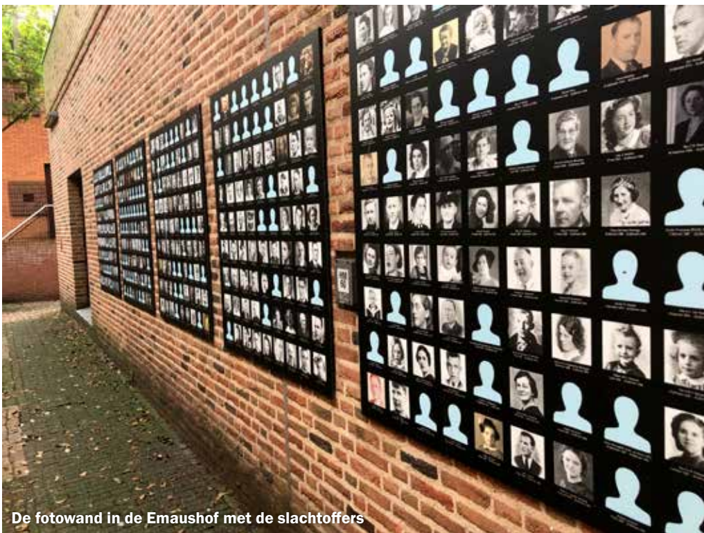
De fotowand in de Emaushof met de slachtoffers