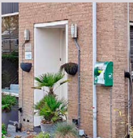
De nieuwe AED op Lankforst 12-02