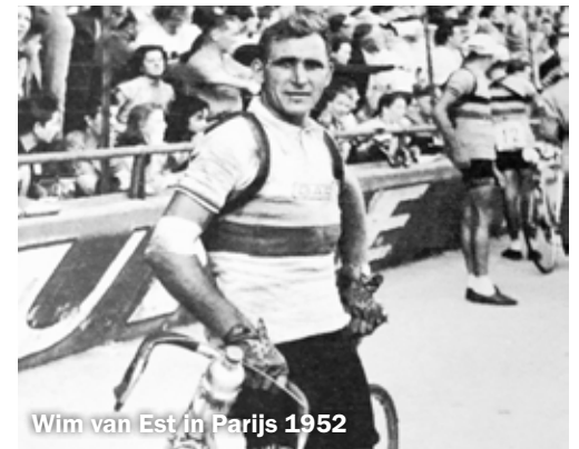
Wim van Est in Parijs 1952

Begin jaren 1950 gingen Nederlandse wielrenners internationaal meedoen. In 1951 was na een etappeoverwinning in de Pyreneeën Wim van Est de eerste Nederlander aan wie de Gele Trui werd uitgereikt. Lang mocht hij hier niet van genieten want de volgende dag in de afdaling van de Col d'Aubisque viel hij in een zeventig meter diep ravijn, kwam hier wonderwel ongedeerd uit maar zijn Tour was afgelopen.