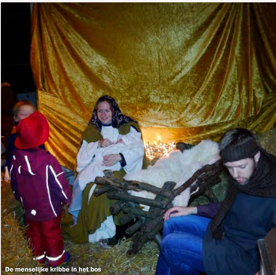
De menselijke kribbe in het bos

De NCGK Nijmegen organiseert dit jaar weer een Kerstlichtjestocht in het Augustijnenbos. Op zaterdagavond 23 december vindt de Kerstlichtjestocht plaats. Tussen 17.00 en 19.00 uur kunnen bezoekers starten met een wandeling door het sfeervol verlichte Augustijnenbos. Op de route wordt door vrijwilligers het kerstverhaal verteld en uitgebeeld.