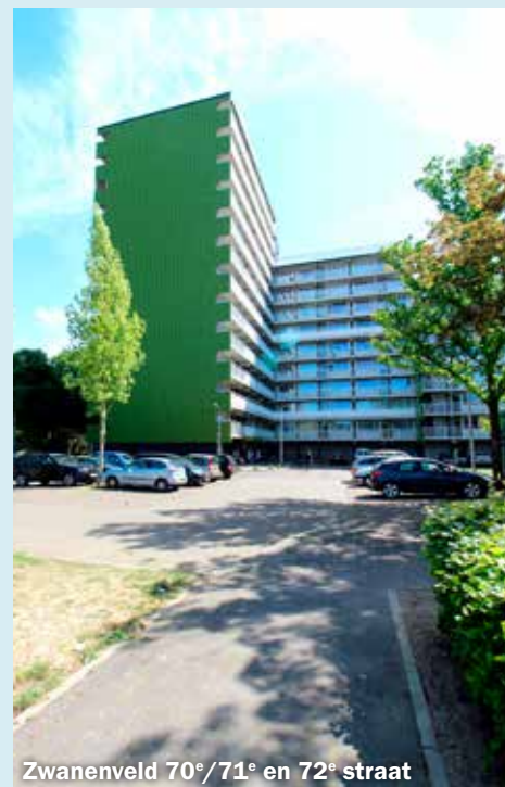
Zwanenveld 70°/71° en 72° straat