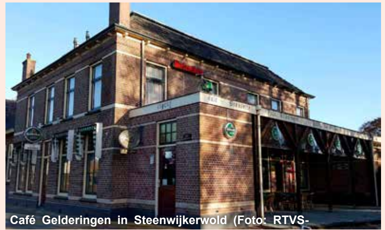
Café Gelderingen in Steenwijkerwold