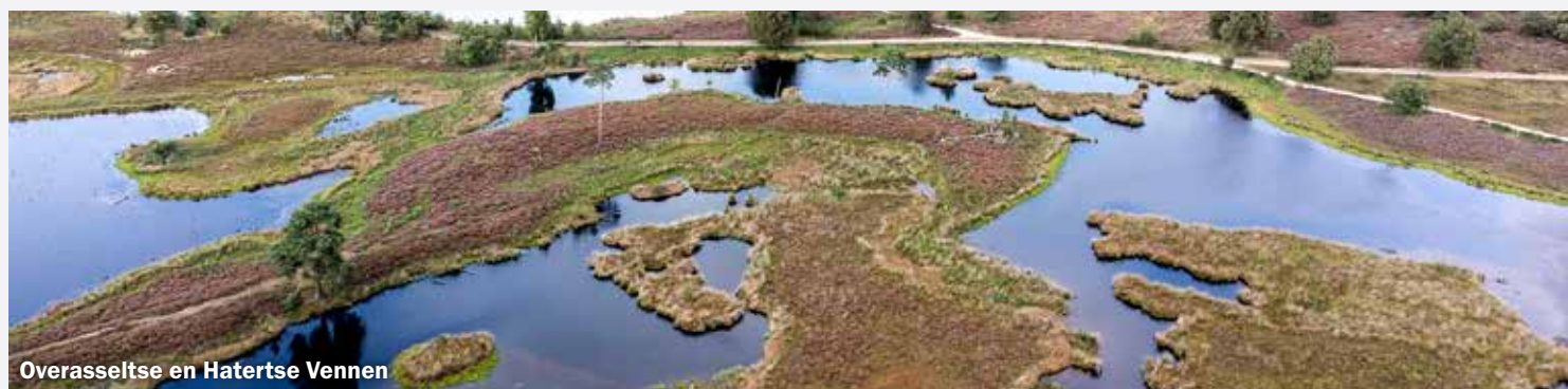
Overasseltse en Hatertse Vennen

De Stichting Vrienden van de Vennen heeft onlangs een zeer kritische reactie gestuurd naar de gemeente Wijchen over twee onderzoeksrapporten. De onderwerpen betreffen de verwachte toename van de recreatiedruk in het vennengebied en daarnaast de verwachte toename van verkeersdruk op de Heumenseweg.