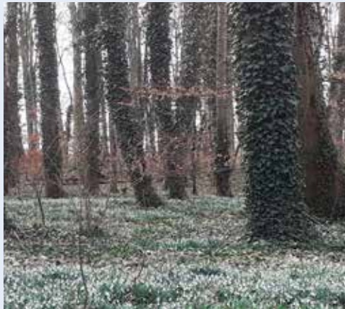
Tapijt sneeuwkllokjes in Bos-van-de-Barones

buitenplaats Oosterhout in het bosperceel van de Barones. Logeerden de Van Boetzelaers er of wóonde de Duitse familie hier enige tijd? Logeren okee, plek zat. Maar woonadres: nee.