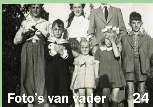
Foto's van vader 24