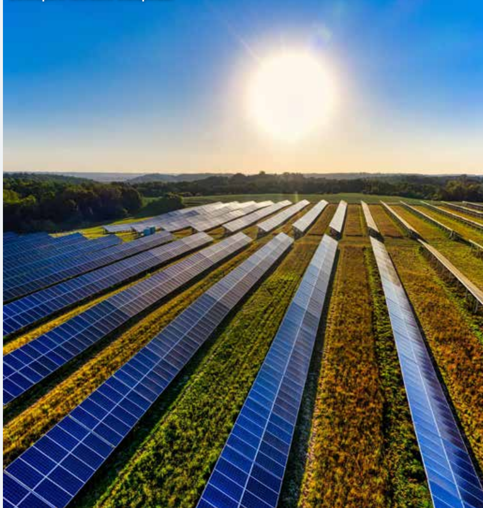
Zonnepark Teersche Sluispolder

Toch wel. Zo maakte de Belangenvereniging Weezenhof in december 2023 de stand van zaken op rond de nieuwbouw van het winkelcentrum in de wijk.