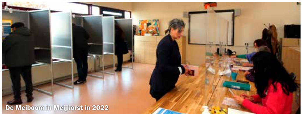
De Meiboom in Meijhorst in 2022

De tweede tabel geeft aan hoe Dukenburg in 2021 en 2023 heeft gestemd in vergelijking met de stad Nijmegen en Nederland als geheel. Opnieuw zien we opvallend grote verschillen. In Dukenburg stemmen meer kiezers op de PVV (29,3 procent) dan landelijk (23,5 procent). Het verschil met de stad als geheel is nog veel groter: ‘slechts’ 14,7 procent van alle Nijmegenaren koos voor de PVV en 34,3 procent op GL/PvdA. In ons stadsdeel is de PVV bijna 10 procent populairder dan de linkse opponent.