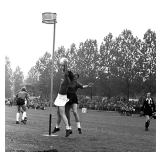
1974: interland tegen België met voor het eerst een vrouwelijke scheidsrechter

is geen olympische sport, maar is wel erkend door het I.O.C. (Internationaal Olympisch Comité) en heeft nog steeds een olympische status. Misschien wordt het ooit olympisch!!