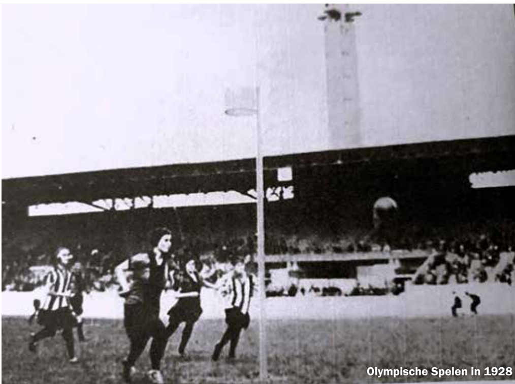
Olympische Spelen in 1928

in Amsterdam - alsmede de Leidse clubs Vitesse en Fluks werden langzamerhand overvleugeld door clubs als Deetos uit Dordrecht, het Rotterdamse het Zuiden, maar vooral door twee Amsterdamse verenigingen: Blauw Wit - zes keer kampioen van Nederland - en Westerkwartier. Deze laatste werd tien maal kampioen van Nederland. Deze verenigingen speelden sinds 1939 een vooraanstaande rol in de competitie van de Korfbalbond. Aan deze bond werd bij het 35-jarig bestaan in 1938 het predikaat Koninklijke verleend.