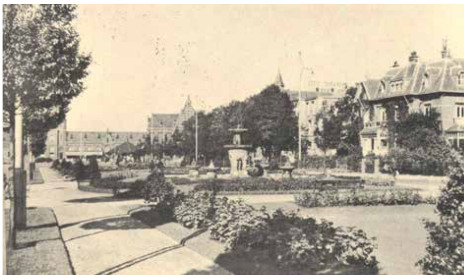
Burgemeester Van Schaeck Mathonsingel eind jaren 20. Op de achtergrond het station