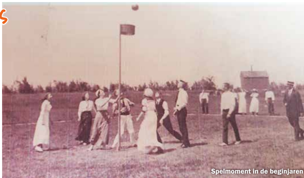
Spelmoment in de beginjaren

manier van sporten viel niet erg in de smaak bij het publiek. Men probeerde korfbal belachelijk te maken. Men vond dat vrouwen niet op een sportveld hoorden te staan. Begin twintigste eeuw beoefenden meisjes geen sport. Maar Broeckhuysen trok zich van dit alles niets aan. Het gevolg hiervan was dat steeds meer mensen zich voor korfbal begonnen te interesseren.