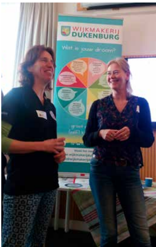
WijkMakerij in actie op Kern met Pit-bijeenkomst