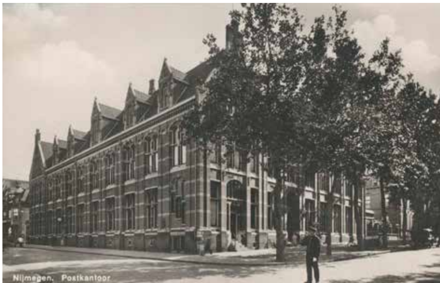
Het Postkantoor in begin jaren 30. Rechts de Van Schevichavenstraat, links de Van Broeckhuysenstraat