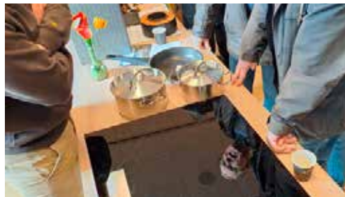
Gasloos betekent nieuwe pannen op een nieuwe kookplaat

De woningen in deze complexen worden aangesloten op een warmtenet. Warm water komt vanaf een centraal punt voor verwarming en warm water niet meer via de cv-ketel. De temperatuur voor de verwarming en het warme