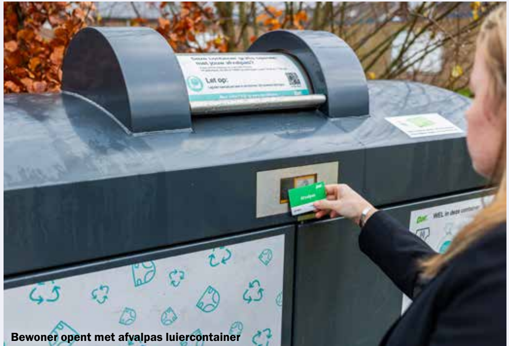
Bewoner opent met afvalpas luiertank

Volle luierzakken brengen inwoners naar een luiertank. Deze staan op verschillende plekken in de gemeente Nijmegen.