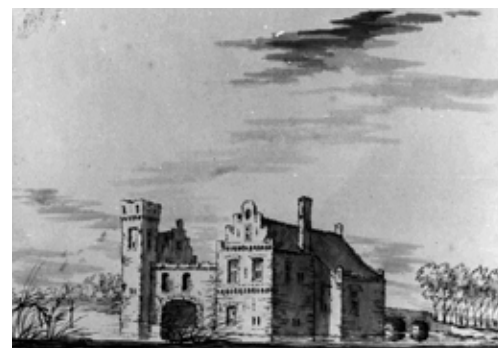
Oosterhout in 1649

In 1627 ging het kasteel door vererving naar de familie Van HACFORT Ter Horst 2) 3) en werd het vernoemd naar het dorp Oosterhout. Vanaf die tijd werd het kasteel Oosterholt of Oosterhout genoemd.