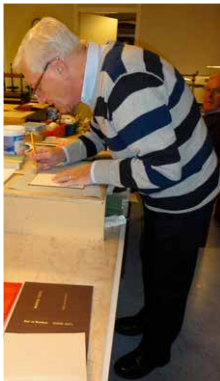
Ad repareert zijn oude boeken

Ieder, jong of oud, kan dus op elk willekeurig moment aan deze hobby begin-