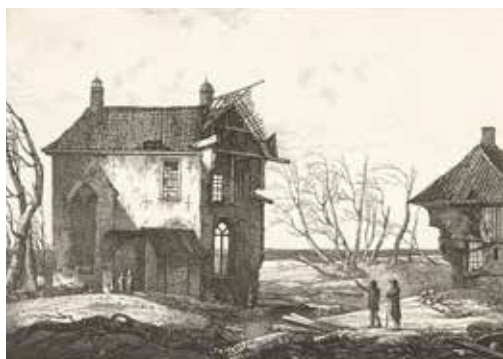
Het verwoeste huis Oosterhout