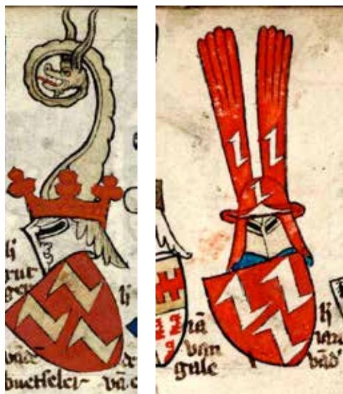
Uit het Wapenboek Gelre (1395-1402): links Van Boetseler en rechts Van Gale

In een tekstvak in de Dukenburger wordt kort de herkomst van Van BOETZELAER verklaard. De Van BOETZELAER en de Van GALEN waren verwant aan elkaar, want lang geleden – veertiende, vijftiende eeuw – waren er verschillende huwelijken tussen beide geslachten. De wapenschilden verschillen nauwelijks van elkaar. Van BOETZELAER heeft gouden wolfsangels en Van GALEN zilver, beide op een rood schild.