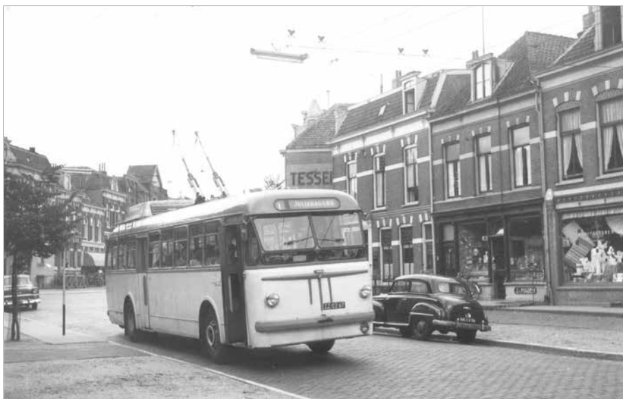
Stijn Buysstraat met trolleybus van lijn 1, 13 juli 1957