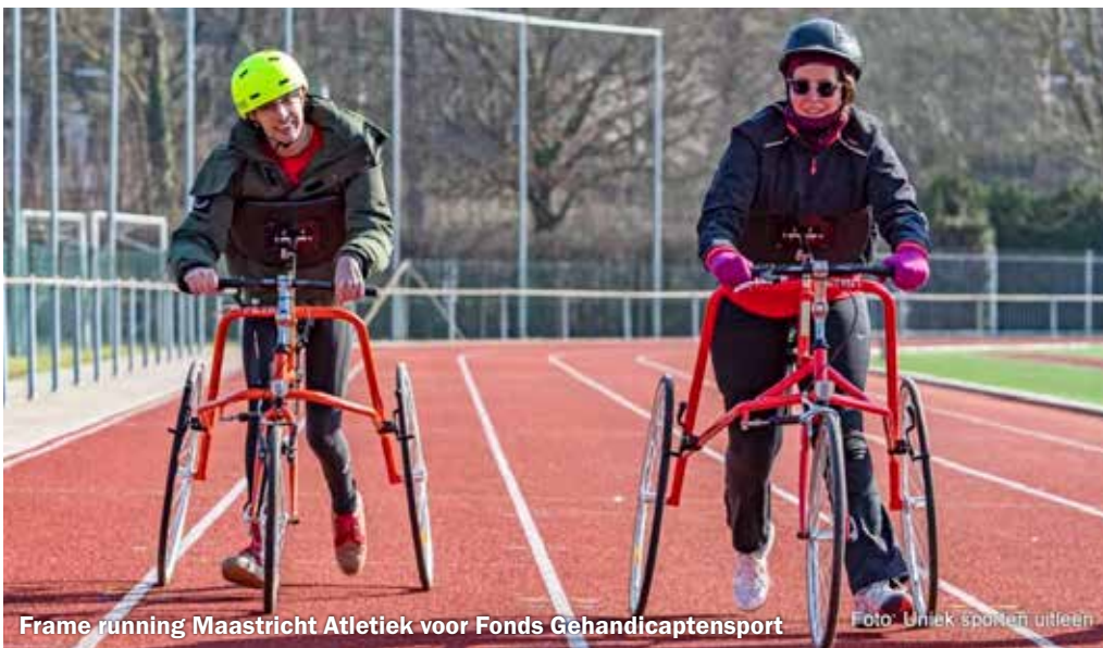
Frame running Maastricht Atletiek voor Fonds Gehandicapsport