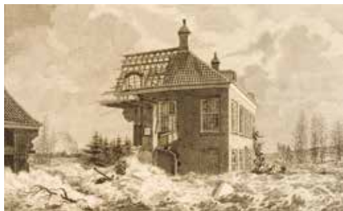
Het huis Oosterhout in een overstroming, 1820

Naast de brand in 1585 had huis Oosterhout ook te maken met verwoestende overstromingen van de Waal. Huis Oosterhout werd in 1809 door het kruierende ijs vrijwel verwoest en op dezelfde plek verrees een nieuw adellijk huis.